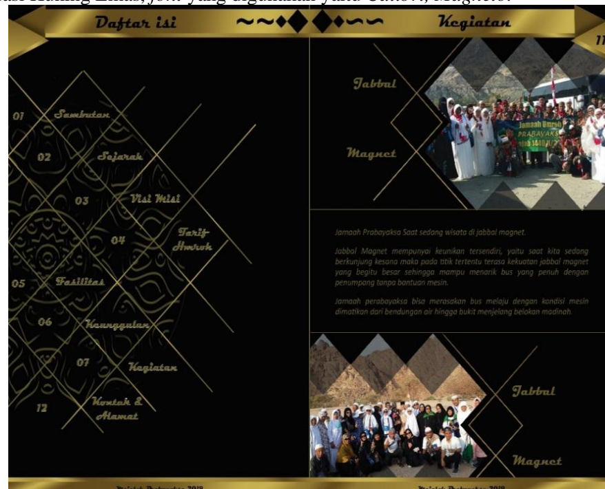
Gambar 3. Final Artwork daftar isi city tour ke jabbal magnet