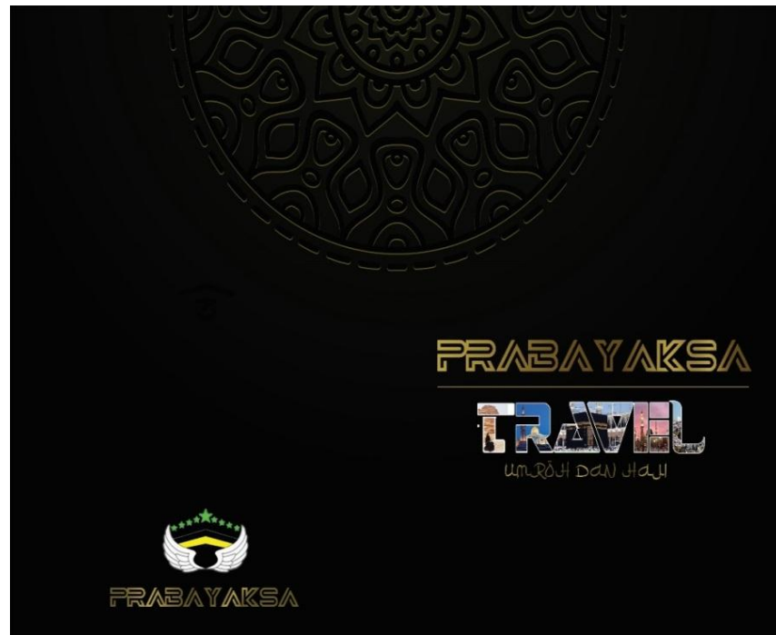
Gambar 1. Final Artwork Cover Depan dan Cover Belakang