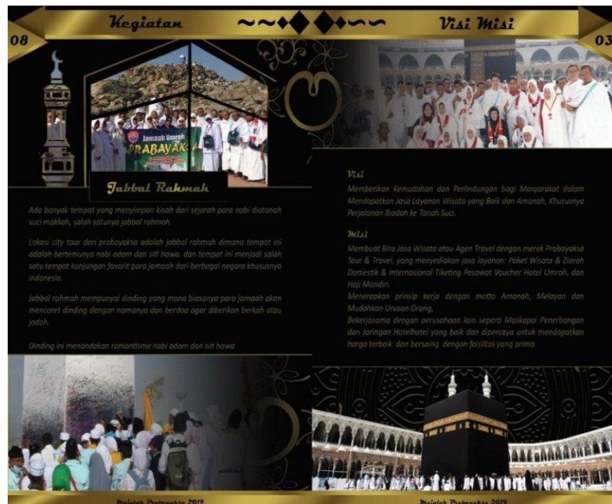
Gambar 6. Desain Buku Sampul