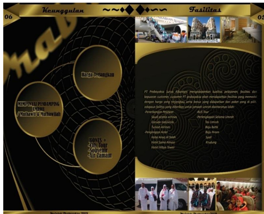
Gambar 8. Final Artwork Fasilitas dan Keunggulan Perusahaan

Desain dari Halaman 5 ini berisi Foto-Foto Jamaah Prabayaksa, Fasilitas dan keterangan tentang foto. Dan halaman 6 berisi tentang Keunggulan dari Perusahaan. Desain ini berwarna Hitam dan Gradasi Kuning Emas, font yang digunakan yaitu Calibri, Magneto