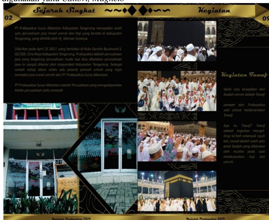
Gambar 5. Final Artwork Sejarah Singkat Perusahaan dan Kegiatan Tawaf