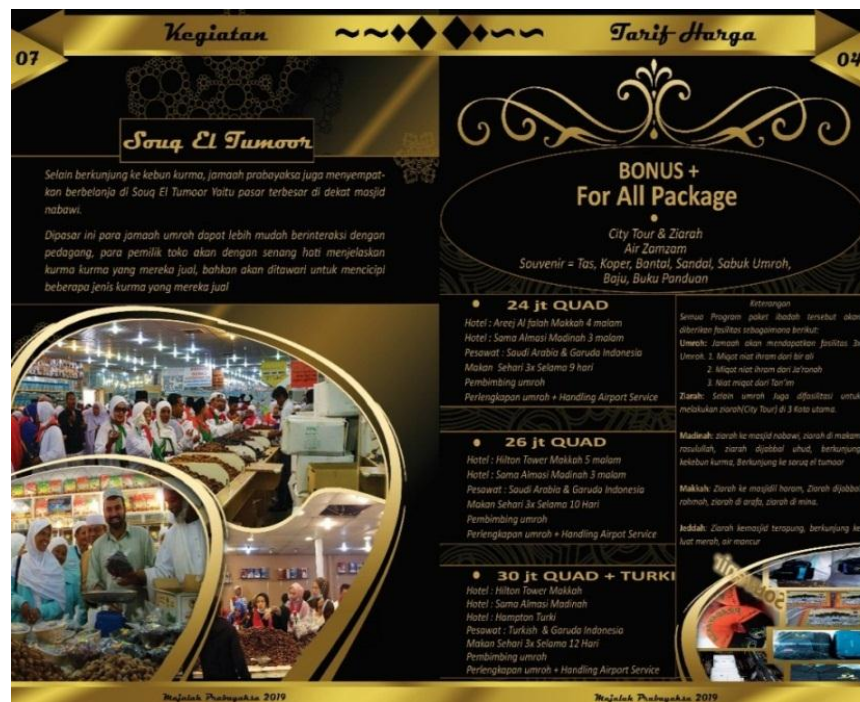
Gambar 7. Final Artwork Tariff Harga dan City Tour Ke Soruq El Tumor