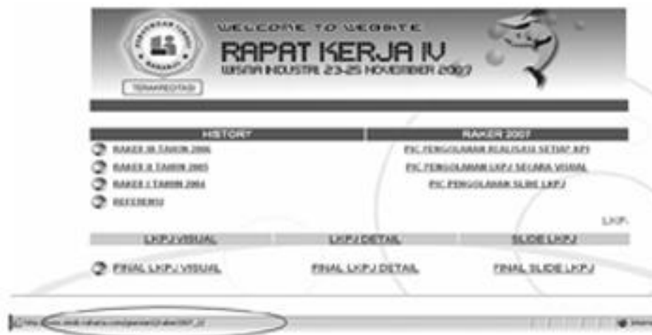
Gambar 1. Contoh tampilan penerapan konsep dan cara kerja e-leadership pada kegiatan pengorganisasian sebuah kegiatan

waktu tenaga, seorang manajer dapat menggunakan diagram PERT . Diagram PERT dapat membantu manajer dalam melakukan pengorganisasian sumber daya waktu dan tenaga untuk melakukan suatu kegiatan yang telah ditetapkan pada tahapan perencanaan. Diagram PERT telah memuat dan menerapkan konsep e-leadership karena sistem ini dapat melakukan analisis dan membuat beberapa formula pengelolaan sumber daya waktu dan tenaga untuk melakukan suatu kegiatan. Selain dengan menggunakan beberapa paket software yang sudah disiapkan oleh berbagai vendor, penerapan konsep dan cara kerja e-leadership pada kegiatan pengorganisasian juga bisa dilakukan oleh manajer dengan cara memadukan prinsip konektivitas dan cara kerja web. Perpaduan prinsip konektivitas dan cara kerja web dapat membantu manajer dalam melaksanakan pengorganisasian sumber daya manusia untuk setiap kegiatan. Penerapan konsep dan cara kerja e-leadership menggunakan perpaduan prinsip konektivitas dan cara kerja web dilakukan dengan cara membagi suatu kegiatan yang besar menjadi kegiatan-kegiatan yang lebih kecil, dan menetapkan personal in charge (PIC) untuk setiap kegiatan-kegiatan tersebut dan mengorganisasikannya dalam sebuah web. Berikut ini contoh penerapan konsep dan cara kerja e-leadership menggunakan prinsip konektivitas dan cara kerja web.