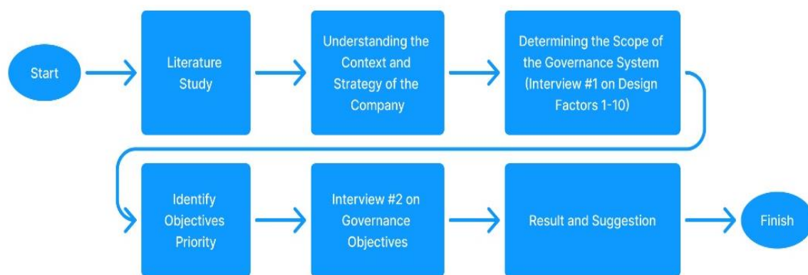
Gambar 1. Metodologi Penelitian