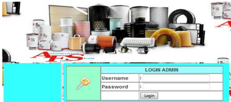
Gambar 3. Halaman Login Admin

Administrator harus melakukan login terlebih dahulu untuk dapat menggunakan menu yang ada. Jika login berhasil maka akan tampil halaman utama admin.