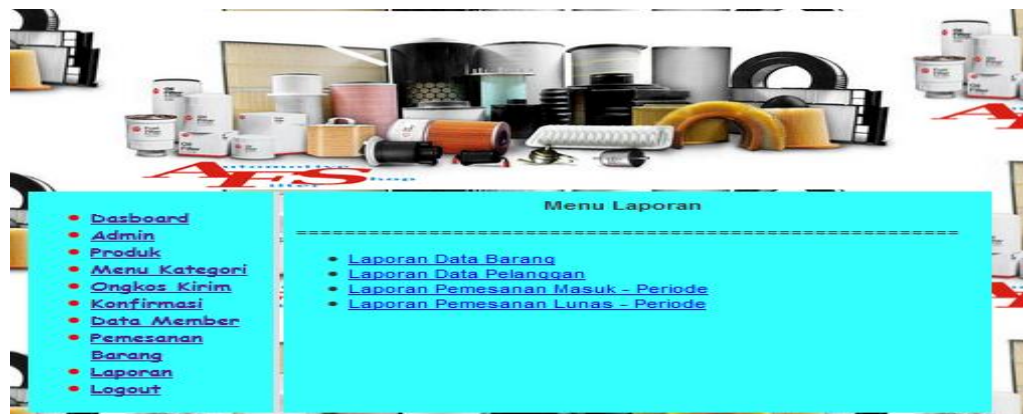
Gambar 8. Halaman Laporan

Admin dapat melihat data laporan barang, pelanggan, pemesanan masuk dan pemesanan lunas.