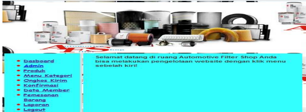
Gambar 4. Halaman Utama Admin

Setelah user berhasil melakukan login, maka user akan diarahkan ke halaman utama ( index ) Administrator. Pada halaman ini user nantinya dapat melakukan pengolahan data- data, seperti melihat, menambah ataupun merubah data produk melalui menu-menu yang tersedia.