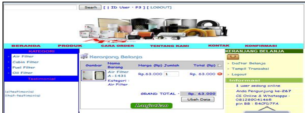
Gambar 7. Halaman Keranjang Belanja

User yang telah mendaftar menjadi member atau pelanggan dapat melakukan proses pembelian filter mobil dan disimpan pada keranjang belanja.