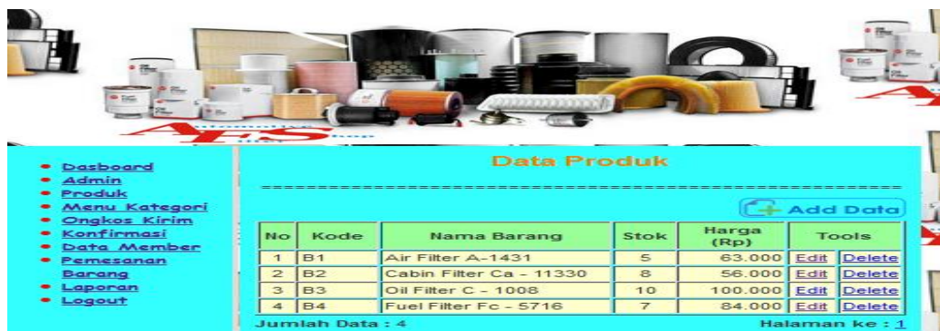
Gambar 5. Halaman Data Produk Filter Mobil