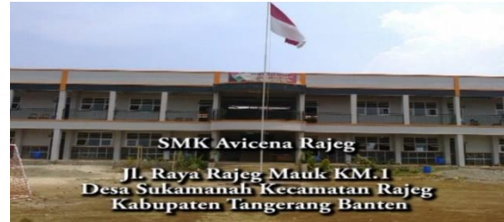
Gambar 17. Gedung Sekolah