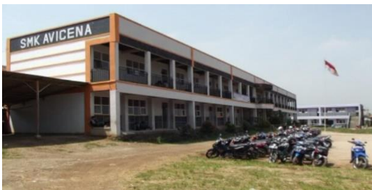
Gambar .4. Gedung Sekolah