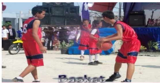
Gambar 13. Ekstrakurikuler