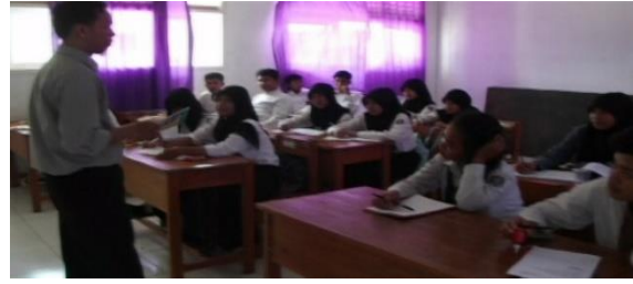
Gambar 9. Kegiatan Belajar