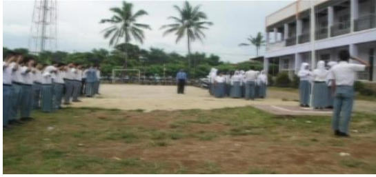
Gambar 8. Upacara Bendera