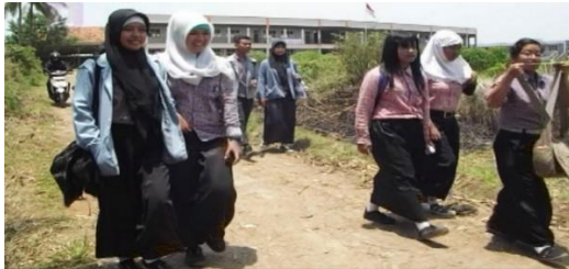
Gambar 16. Suasana Pulang Sekolah