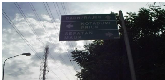
Gambar 5. Penunjuk Jalan Ke SMK Avicena