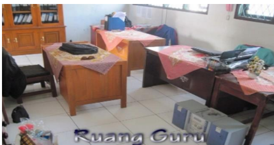
Gambar 12. Ruang Guru