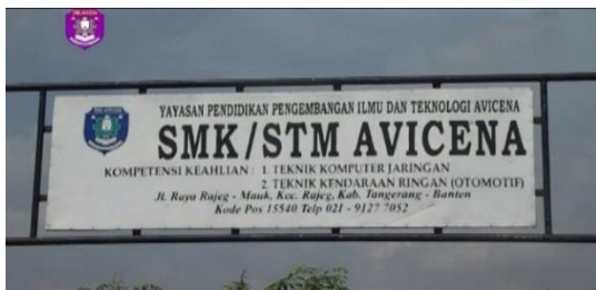
Gambar 6. Papan Nama sekolah