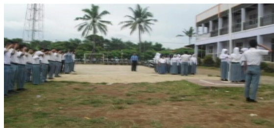
Gambar 7. Upacara Bendera