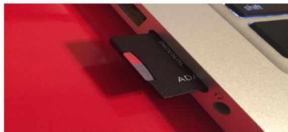
Gambar 2. SD Card

Sebelum memilih opsi install on an SD Card, masukkan SD Card dan hubungkan ke laptop menggunakan Adaptor atau Cardreader. Pastikan SD Card tersebut dalam keadaan kosong, disarankan sebelum melakukan penginstalan SD Card terlebih dahulu di Format agar memastikan SD Card tersebut dalam keadaan kosong tidak terisi file apapun. Diharuskan SD Card tersebut memiliki kapasitas minimal 4GB dan mempunyai class 10 agar saat melakukan penginstalan tidak mengalami error. Jika SD Card sudah terhubung ke laptop, klik opsi install on an SD Card.