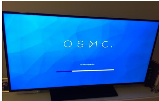
Gambar 3. Booting OSMC

Pasang perangkat keras pada Raspberry Pi seperti keyboard, mouse, kabel HDMI, power supply 5v(Charger Adaptor). Jika perangkat keras sudah terpasang semua pada Raspberry Pi, maka tahap selanjutnya yaitu menghubungkan kabel HDMI dari Raspberry ke Televisi dan juga hubungkan Powersupply Raspberry ke listrik. Maka secara otomatis Raspberry akan melakukan booting interface OSMC.