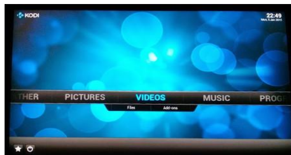
Gambar 4. Interface OSMC

Setelah proses booting selesai maka akan muncul tampilan interface OSMC yang bernama Kodi. Terdapat beberapa opsi seperti Video, Musik, Gambar, Setting. Pilih opsi video lalu masuk ke penyimpanan dan putar video yang ingin ditampilkan pada Televisi tersebut.