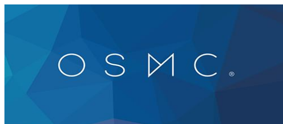
Gambar 1. OSMC ( Operating System Media Center )

OSMC ( Open Source Media Center ) adalah media player gratis dan open source berbasis Linux. Didirikan pada tahun 2014, OSMC memungkinkan Anda bermain kembali media dari jaringan, penyimpanan terpasang lokal dan internet. OSMC adalah pusat media terkemuka dalam hal set fitur dan masyarakat dan didasarkan pada Kodi proyek.