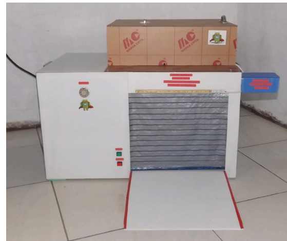
Gambar 1. Prototipe Rolling Door

Gambar diatas merupakan prototype roling door hasil dari penelitian, sebagai replka dari rolling door yang sebenarnya