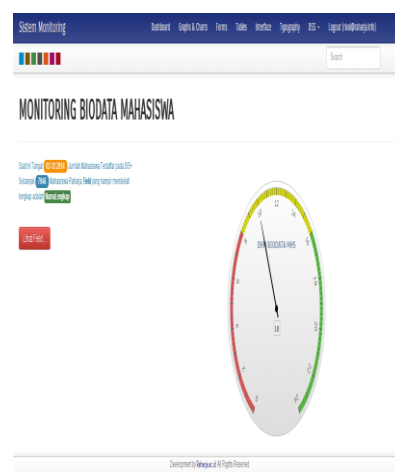
Gambar 6. DHM Biodata Mahasiswa

Tampilan diatas merupakan tampilan DHM biodata foto dimana pada grafik tersebut menunjukkan indikator kesehatan database dalam status AMAN. Status tersebut diperoleh dengan melihat jumlah field yang kosong dalam hal ini adalah field pada column foto.