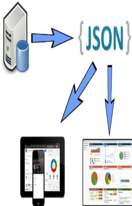
Gambar 4. Proses Penyajian Informasi

Pada gambar 4 diatas merupakan alur proses penyajian data mulai dari database hingga ke dalam bentuk dashboard . Data tersimpan di dalam database yang kemudian diolah menjadi sebuah JSON . Dari JSON tersebut data akan diolah kembali yang kemudian dapat dijadikan sebuah grafik atau dapat diimplementasikan juga ke dalam perangkat mobile .