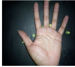
Gambar 1. Citra Asli

kemudian meresize ukuran citra menjadi ukuran 640x480 piksel dan mengubah citra tersebut menjadi grayscale dengan 256 derajat keabuan dan kemudian dilakukan proses cropping .