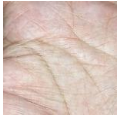
Gambar 2. Citra Cropping

kemudian meresize ukuran citra menjadi ukuran 640x480 piksel dan mengubah citra tersebut menjadi grayscale dengan 256 derajat keabuan dan kemudian dilakukan proses cropping .