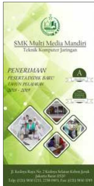
Gambar 10. Banner

Gambar 9 adalah baliho merupakan salah satu media promosi yang mempunyai tujuan untuk menginformasikan kepada masyarakat luas bahwa SMK Multimedia Mandiri sedang mengadakan penerimaan peserta didik baru tahun ajaran 2018 - 2019. Selain penerimaan peserta didik baru, terdapat juga status akreditasi sekolah SMK Multimedia Mandiri dan informasi mengenai penawaran beasiswa dengan syarat dan ketentuan yang berlaku. Baliho dibuat dengan ukuran 6 X 4 M menggunakan bahan Flexi Korea.