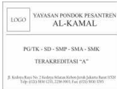
Gambar 7. Konsep desain papan nama

terdapat gambar yang nantinya dapat mewakili informasi yang ingin disampaikan, di bawah gambar terdapat informasi mengenai penerimaan siswa tahun ajaran baru dan logo akreditasi sekolah dan di bagian terakhir terdapat footer yang mungkin nantinya dapat berisi alamat sekolah maupun informasi lain yang ingin disampaikan.