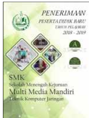
Gambar 9. Baliho

Berikut 8 media yang telah dirancang untuk menunjang promosi pada SMK Multi Media Mandiri.