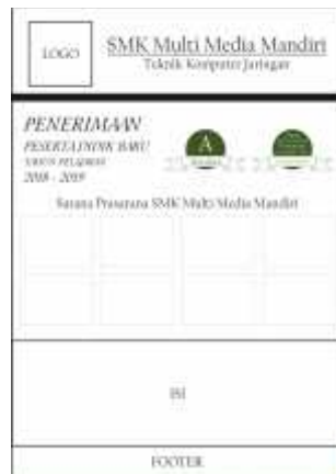
Gambar 5. Konsep desain pamflet