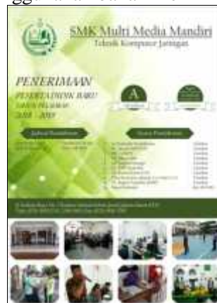
Gambar 12. Flyer

Gambar 11 adalah brosur, merupakan media promosi yang berisi informasi mengenai SMK Multimedia Mandiri seperti ruang lingkup sekolah, program sekolah, ekstrakurikuler, prestasi, mitra industri, jadwal pendaftaran, syarat pendaftaran, tempat pendaftaran, dan kontak yang dapat dihubungi untuk mengetahui informasi lebih lanjut yang ditujukan kepada masyarakat luas. Brosur dibuat menggunakan bahan Flexi Korea dengan ukuran 30 X 42 CM.