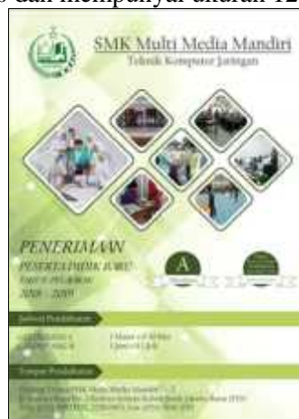
Gambar 15. Poster

Gambar 14 papan nama bukanlah sebagai media promosi, melainkan papan yang digunakan untuk menunjukkan adanya sebuah sekolah yang umumnya diletakkan di depan sekolah dan menjadi identitas SMK Multimedia Mandiri. Papan nama dibuat dengan menggunakan bahan plat stainless dan mempunyai ukuran 120 X 90 CM.