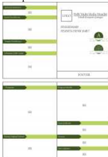
Gambar 3. Konsep desain brosur

baliho sebelumnya namun peletakan logo pada banner terdapat di bagian tengah, layout seluruhnya hampir sama dengan konsep desain baliho.