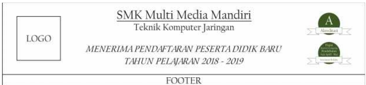
Gambar 8. Konsep desain spanduk

Konsep desain papan nama yang nantinya akan diletakkan di depan gerbang sekolah apabila sudah jadi mempunyai logo yayasan atau sekolah di bagian kiri atas dan terdapat nama yayasan di sebelah kanan logo, lalu terdapat tingkatan pendidikan yang ada pada yayasan mulai dari playgoup /TK, Sekolah Dasar (SD), Sekolah Menengah Pertama (SMP), Sekolah Menengah Atas (SMA), dan Sekolah Menengah Kejuruan (SMK) dengan akreditasi yang sudah diberikan, serta di bagian bawah papan nama terdapat informasi mengenai alamat sekolah.