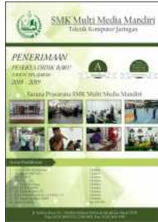
Gambar 13. Pamflet

Gambar 13 pamflet merupakan media promosi yang berisi informasi mengenai SMK Multimedia Mandiri untuk menarik minat masyarakat agar mendaftar di SMK Multimedia Mandiri, informasi yang terdapat pada pamflet yaitu penerimaan peserta didik baru, status akreditasi, beasiswa, syarat pendaftaran, alamat sekolah, dan nomor telepon yang dapat dihubungi. Selain informasi tersebut, terdapat beberapa gambar sarana dan prasarana yang ada pada SMK Multimedia Mandiri untuk memberikan gambaran kepada masyarakat luas. Pamflet dibuat dengan bahan Flexi Korea berukuran 21 X 29,7 CM.