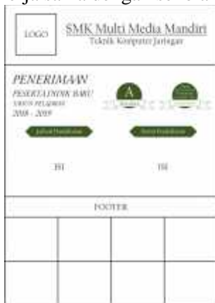
Gambar 4. Konsep desain flyer

Gambar di atas merupakan layout dari konsep desain brosur yang telah dibuat pada penelitian ini, pada lembar pertama terdapat cover yang memiliki layout sama dengan konsep desain baliho yang telah dibuat sebelumnya, lalu pada lembar kedua terdapat informasi mengenai jadwal pendaftaran, syarat pendaftaran, lokasi pendaftaran, dan beberapa informasi lain yang dibutuhkan si pembaca, pada lembaran brosur ketiga terdapat kata pengantar dan sambutan serta jangkauan ruang lingkup lulusan, di dalam lembaran brosur terakhir terdapat informasi mengenai program sekolah, ekstrakurikuler, prestasi sekolah, dan mitra industri yang bekerja sama dengan sekolah.