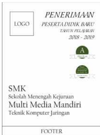
Gambar 1. Konsep desain baliho

Setelah metode pengumpulan data telah selesai dilakukan, selanjutnya yang akan dilakukan adalah tahap metode konsep desain. Di bawah ini merupakan penjabaran dari metode konsep desain yang telah dilakukan dan dibuat: