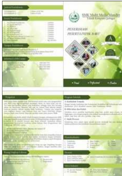
Gambar 11. Brosur

Gambar 11 adalah brosur, merupakan media promosi yang berisi informasi mengenai SMK Multimedia Mandiri seperti ruang lingkup sekolah, program sekolah, ekstrakurikuler, prestasi, mitra industri, jadwal pendaftaran, syarat pendaftaran, tempat pendaftaran, dan kontak yang dapat dihubungi untuk mengetahui informasi lebih lanjut yang ditujukan kepada masyarakat luas. Brosur dibuat menggunakan bahan Flexi Korea dengan ukuran 30 X 42 CM.