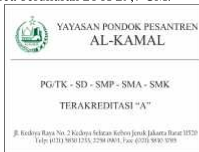
Gambar 14. Papan Nama

Gambar 13 pamflet merupakan media promosi yang berisi informasi mengenai SMK Multimedia Mandiri untuk menarik minat masyarakat agar mendaftar di SMK Multimedia Mandiri, informasi yang terdapat pada pamflet yaitu penerimaan peserta didik baru, status akreditasi, beasiswa, syarat pendaftaran, alamat sekolah, dan nomor telepon yang dapat dihubungi. Selain informasi tersebut, terdapat beberapa gambar sarana dan prasarana yang ada pada SMK Multimedia Mandiri untuk memberikan gambaran kepada masyarakat luas. Pamflet dibuat dengan bahan Flexi Korea berukuran 21 X 29,7 CM.