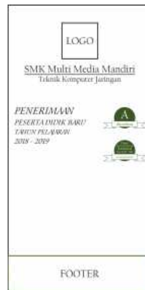
Gambar 2. Konsep desain banner

Gambar di atas adalah konsep desain baliho dan banner yang telah dibuat, apabila dilihat layout baliho pada gambar 1. Terdapat logo SMK Multimedia Mandiri di sebelah kiri bagian atas sehingga logo dapat lebih mudah dilihat dan dikenali. Logo akreditasi dan pemberian beasiswa terletak di sebelah kanan, di bawah kalimat “Penerimaan Peserta Didik Baru” sehingga pembaca akan langsung melihat akreditasi & informasi mengenai pemberian beasiswa setelah membaca kalimat pertama. Terakhir di bagian bawah terdapat footer yang dapat berisi catatan kaki atau informasi lain yang dibutuhkan pembaca. Sedangkan apabila dilihat layout banner pada gambar 2. Tidak terdapat banyak perbedaan desain dengan konsep