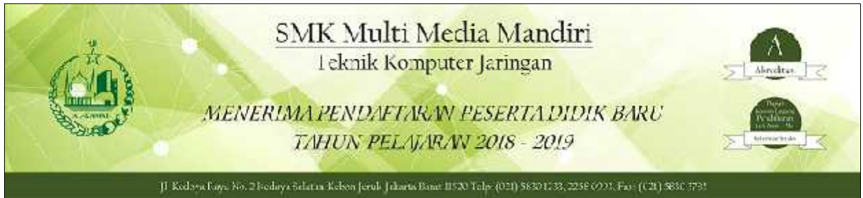
Gambar 16. Spanduk

Gambar 15 poster merupakan media promosi yang bertujuan untuk menarik minat masyarakat luas untuk mendaftar di SMK Multimedia Mandiri serta memberikan informasi mengenai penerimaan peserta didik baru yang akan dipasang di tempat umum yang sering dilihat oleh khalayak ramai. Poster dibuat dengan ukuran 21 X 29,7 CM menggunakan bahan Flexi Korea.