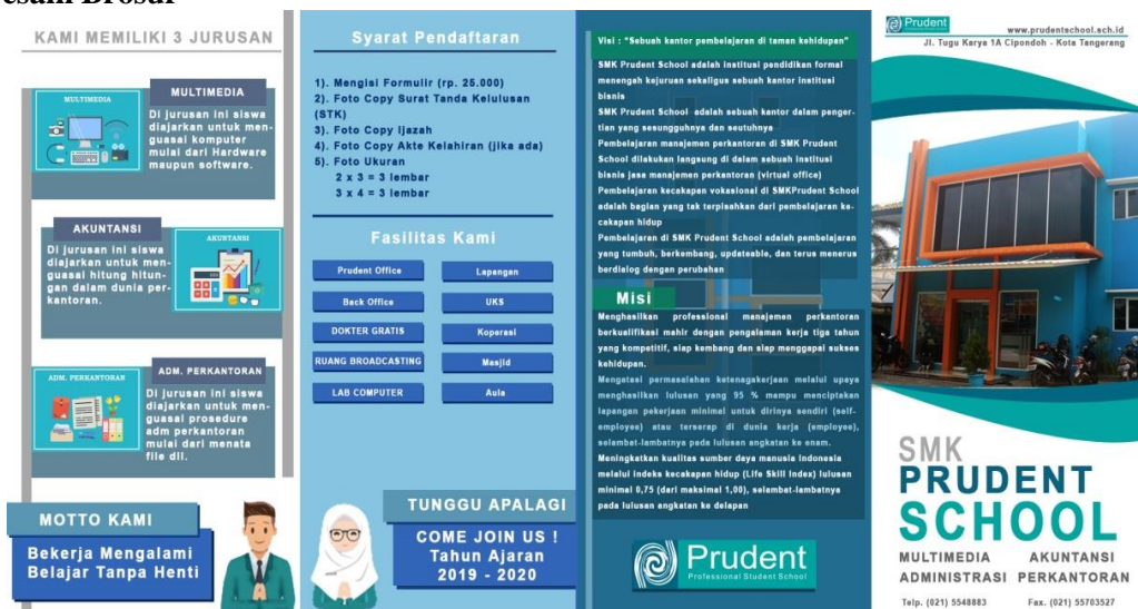
Gambar 5. Desain Brosur