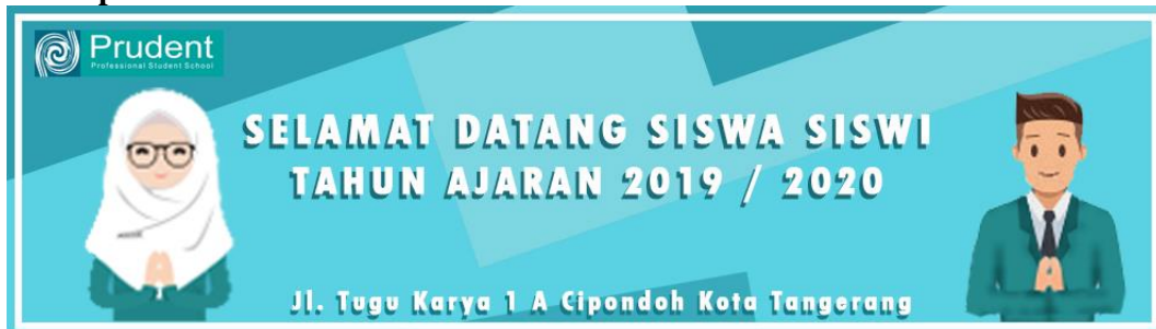
Gambar 4. Desain Spanduk