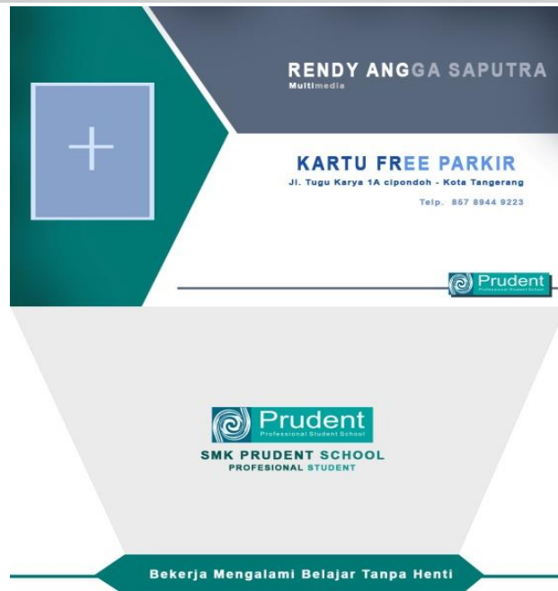
Gambar 6. Desain Kartu Free Parkir