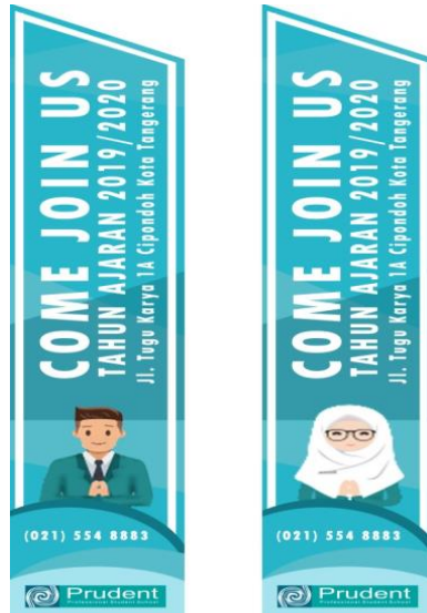
Gambar 3. Desain Umbul – Umbul