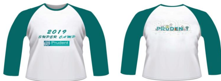
Gambar 3.7. Desain Baju Super Camp