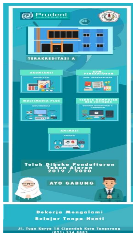
Gambar 2 Desain X Banner