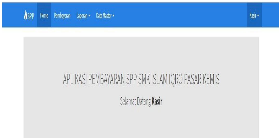
Gambar 3. Tampilan Dashboard

Gambar 3 merupakan halaman utama yang menyajikan menu-menu yang dapat diakses, dimana halaman ini muncul setelah admin berhasil memasukkan username dan password pada saat login.