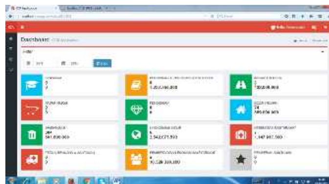
Gambar 4a. Dashboard Penyaluran Dana CSR Per Kegiatan

Prototipe executive dashboard lembaga CSR dapat menampilkan informasi berbentuk digital dashboard yang dapat memberikan gambaran umum pencapaian kinerja KPI yang dilakukan oleh CCSR dalam mengelola dana CSR perusahaan-perusahaan di kota Cilegon. Gambar 4a sampai dengan 4c memperlihatkan hasil executive dashboard yang dihasilkan prototipe executive dashboard pada CCSR.