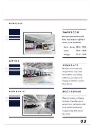
Gambar 11 Final Artwork Halaman showroom, workshop dan body repair

e. Halaman Showroom, Workshop, dan Body Repair