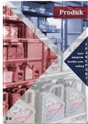
Gambar 8 Final Artwork Halaman Produk Tunas Toyota Cipondoh

Pada gambar 7 diatas menggambarkan desain cover media katalog dengan foto CRC tunas Toyota cipondoh dan barcode