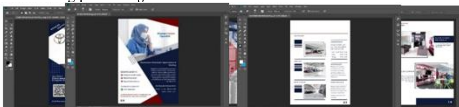
Gambar 6 Layout Komprehensif produk digital Tunas Toyota Cipondoh

Layout Komprehensif adalah proses desain masuk ke tahapan komputerisasi dengan menggunakan software desain grafis yaitu Adobe Photoshop CC 2019 dan warna yang disertai dengan deskripsi informasi, tampilan layout komprehensif dalam perancangan media katalog produk digital :