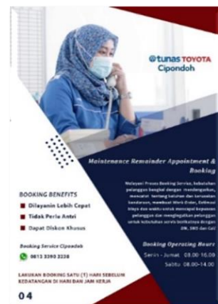
Gambar 10 Final Artwork Halaman Tugas MRA , Booking serta manfaat booking

Pada gambar 10 diatas terdapat Logo Tunas Toyota Cipondoh, foto staff MRA