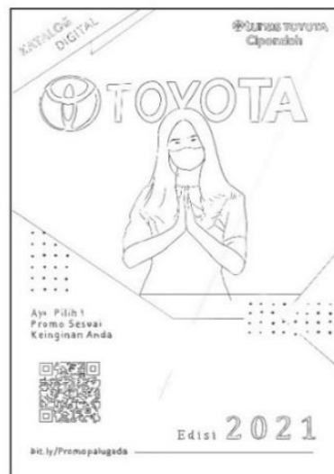
Gambar 1 Layout Kasar Cover Katalog Digital Tunas Toyota Cipondoh

Menuangkan ide atau konsep desain yang sesuai dengan perancangan dengan menggunakan alat gambar seperti pensil dan kertas. Dibawah ini merupakan tampilan dari layout kasar media katalog produk digital :