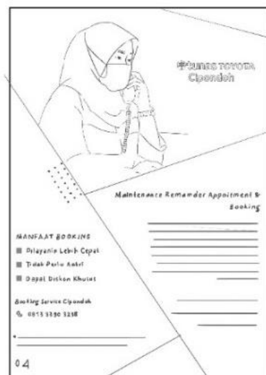
Gambar 5 Layout Kasar Halaman Tugas MRA, Booking serta manfaat booking