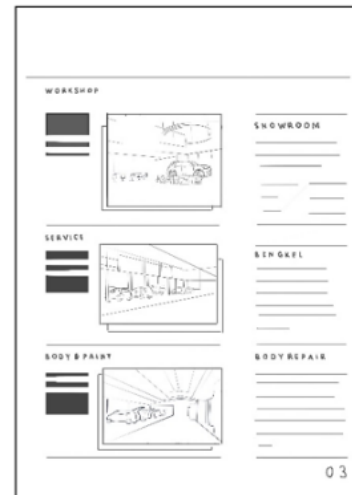
Gambar 4 Layout Kasar Halaman showroom, workshop dan body repair Toyota Cipondoh