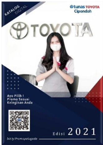
Gambar 7 Final Artwork Cover Media Katalog Produk Digital Tunas Toyota Cipondoh