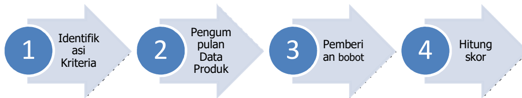
Gambar 2. Tahapan Penilaian Kualitas Produk Dengan SAW

Penelitian ini menggunakan metode Simple Additive Weighting (SAW) untuk mengembangkan model penilaian kualitas produk berdasarkan multikriteria. Metode SAW merupakan salah satu pendekatan yang umum digunakan dalam pengambilan keputusan multi-kriteria, yang memungkinkan penilaian relatif terhadap setiap kriteria yang digunakan. Langkah-langkah dalam penggunaan Metode SAW dapat dilihat pada gambar 2 berikut ini :