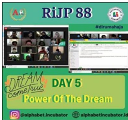
Gambar 5. Kegiatan RiJP Secara Zoom

Dari gambar diatas terlihat bahwa pengabdian mahasiswa kepada masyarakat tidak hanya dapat dilakukan secara offline atau tatap muka secara langsung tapi dapat dilaksanakan secara online dan tanpa melanggar peraturan pemerintah untuk tetap beraktivitas di rumah bukan diluar. Dimana dari penelitian tersebut dapat terlihat mahasiswa di Universitas Raharja dapat langsung membagikan ilmunya kepada mahasiswa baru tanpa perlu melibatkan para dosen dan staf marketing dalam memberikan pelatihan training RiJP. Kegiatan ini bertujuan kepada mahasiswa agar dapat terlibat lebih banyak melakukan kegiatan pengabdian kepada masyarakat tanpa mengkhawatirkan permasalahan dari pandemi dan melatih mahasiswa dalam memanfaatkan teknologi.