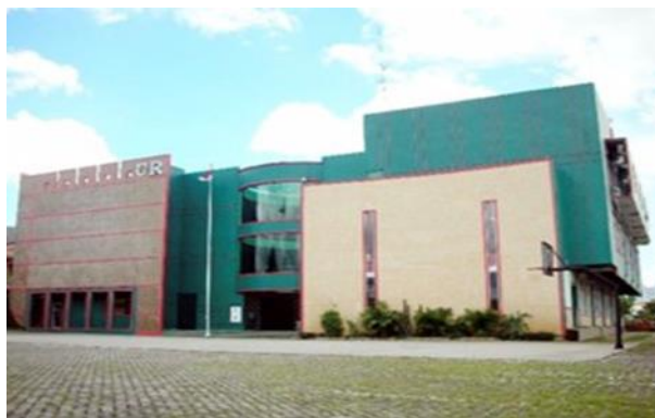
Gambar 1. Universitas Raharja

Universitas Raharja merupakan Perguruan Tinggi yang dikenal dengan Ilmu Komputer karena setiap jurusan yang terkait pasti bersangkutan dengan komputer dan berada di Tangerang dengan lokasi berada di, Jl. Jenderal Sudirman No.40, RT.002/RW.006, Cikokol, Kec. Tangerang, Kota Tangerang,