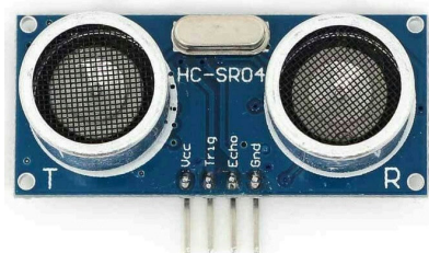
Gambar 2.2 Sensor Ultrasonik HC-SR04

Sensor Ultrasonik HC-SR04 adalah sensor yang menggunakan gelombang ultrasonik untuk mendeteksi keberadaan dan mengukur jarak suatu objek. Prinsip kerjanya mirip dengan radar ultrasonik, di mana gelombang ultrasonik dipancarkan dan diterima kembali oleh receiver. Sensor ini berfungsi dengan frekuensi kerja antara 40 KHz hingga 400 KHz.