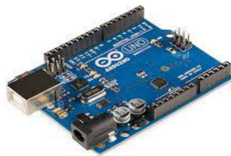
Gambar 2.1 Bentuk Fisik Arduino Uno R3

Arduino Uno adalah sebuah platform elektronik terdiri dari software dan hardware. Hardware-nya sama dengan mikrokontroler pada umumnya, tetapi ada penamaan pin agar mudah diingat. Software Arduino gratis untuk membuat dan memasukkan program ke dalam Arduino. Arduino Uno memiliki SRAM 2KB, EEPROM 1KB, dan Flash Memory 32KB. Gambar Arduino Uno dapat dilihat pada gambar 2.1.