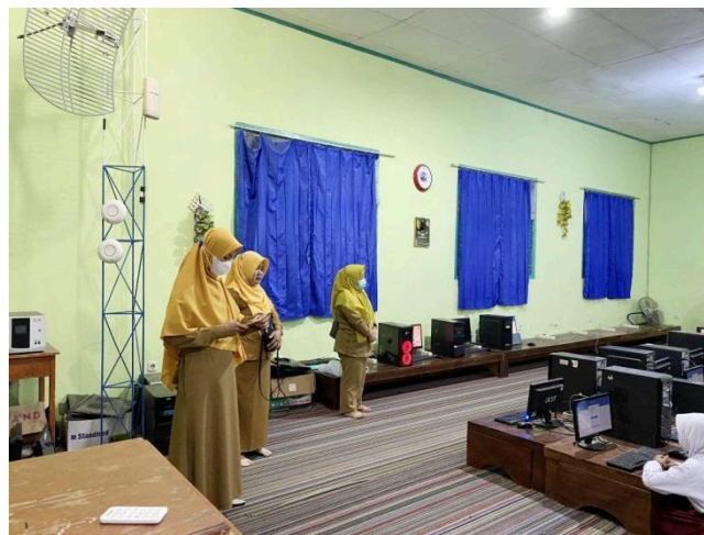
Gambar 1. Sesi Pelatihan di SMK Pelita